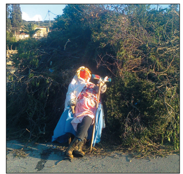
Ο Ιούδας στην Φουνάρα

δείχνουν ότι τους είναι ευχάριστη η ζωή στην ύπαιθρο μακριά από την ταλαιπωρία των μεγαλουπόλεων ζώντας και βιώνοντας τις παραδόσεις και τα έθιμα του τόπου καταγωγής των προγόνων τους.