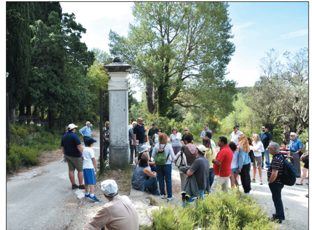
Στην πύλη του ανακτορικού συγκροτήματος

Το Τατόι υπήρξε επίσης το θέατρο σκηνών μεγάλης δραματικής εντάσεως, όπως η εξέγηση του Κωνσταντίνου, το 1917, η αγωνία και ο θάνατος του Βασιλιά Αλέξανδρου, ο θάνατος του Βασιλιά Παύλου. Άπειρες ήταν οι επίσημες ή ανεπίσημες συναντήσεις που πραγματοποιήθηκαν εκεί και που επηρέασαν την πορεία των εθνικών και πολιτικών πραγμάτων: ιδιαίτερα σημαντικές ήταν οι δια-