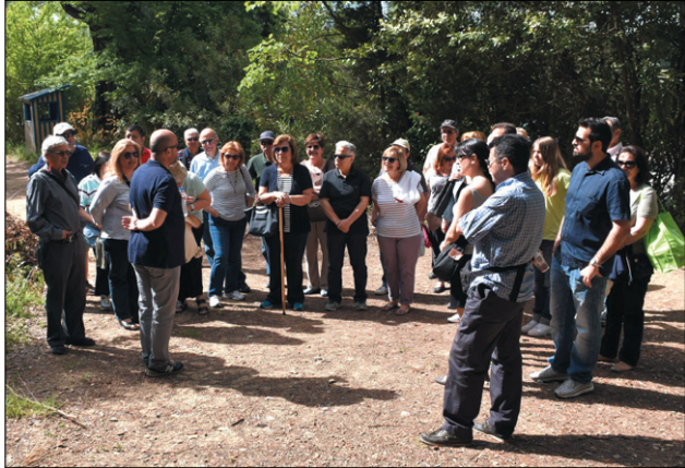
Η παρέα μας με τον ξεναγό στην είσοδο Λεύκας

Όπως ήταν προγραμματισμένο, την Κυριακή το πρωί περίπου σαράντα Φουρνιώτες και Φίλοι της Φουρνής συναντηθήκαμε με τα αυτοκίνητά μας στον Κόμβο της Βαρυμπόμπης και κατευθυνθήκαμε στην είσοδο Λεύκας του κτήματος όπου και παρκάραμε.