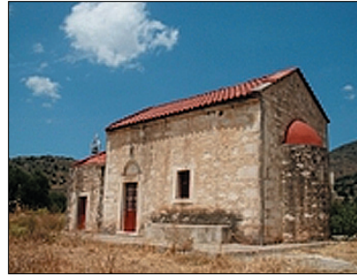
Μονή Καλογεράδων στη Φουρνή

Εκεί τελείωναν τα άξια λόγου, η ιστορία του, καθώς και η παρουσίαση του θέματος! Κάτι ανάλογο συμβαίνει και σε αυτό το βιβλίο, με τη διαφορά ότι αυτό το βιβλίο έτσι έπρεπε να γραφεί.