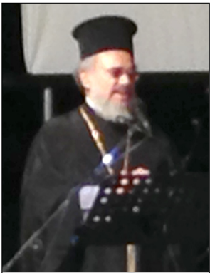
Ο Μακαριστός Επίσκοπος Ολύμπου ΑΝΘΙΜΟΣ κατά την εκδήλωση που έγινε προς τιμήν του στο Καστέλλι τον Αύγουστο του 2014