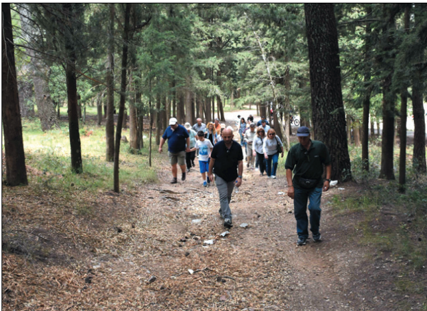
Ανεβαίνοντας στον λόφο του Παλαιοκάστρου προς το Βασιλικό Κοιμητήριο

Την πρώτη δεκαετία του 20ού αι. κτίστηκαν οι πέτρινοι στρατώνες, στα δε 1913/14, επί Κωνσταντίνου Α', το κτίριο του προσωπι-