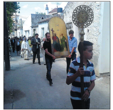
Η περιφορά της εικόνας της Αγίας Τριάδος στο χωριό

ιερέα του χωριού μας με τη συμμετοχή και άλλων ιερέων. Του εσπερινού προέστη ο Αρχιμανδρίτης της Μητροπολιτικής Πετρας και Χερρονήσου κ. Τίτος Ταμπακάκης, ο οποίος στο θείο λόγο που εκφώνησε επεσήμανε τη σπουδαιότητα της ημέρας της Πεντηκοστής και τη θεολογική προσέγγιση της τρισυπόστατης φύσης της Αγίας Τριάδος. Πατήρ, Υιός και Άγιο Πνεύμα σε μία ενότητα, μια φύση, μια δύναμη δίνοντας και σε εμάς το παράδειγμα της ενότητας. Η ημέρα της Πεντηκοστής είναι η πρώτη φανέρωση της εκκλησίας, διότι η εκκλησία υπήρχε προ καταβολής κόσμου ως λόγος των όντων.