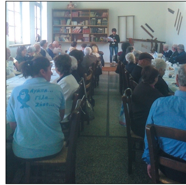
Από την γιορτή της μητέρας

Όπως είναι γνωστό έχει καθιερωθεί παγκοσμίως η δεύτερη Κυριακή του Μαΐου να είναι αφιερωμένη στη Μάνα και να γιορτάζεται η γιορτή της Μητέρας. Ο Πολιτιστικός Σύλλογος του χωριού μας θέλοντας να τιμήσει τη Μάνα, διοργάνωσε και φέτος μια πολύ ωραία εκδήλωση στο χώρο του Δημοτικού Σχολείου.