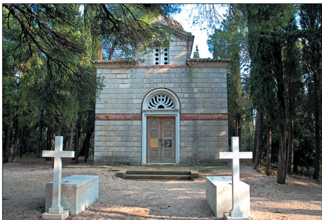
Ο Ναός της Αναστάσεως στο Βασιλικό Κοιμητήριο

Το νέο σπίτι πρωτοκατοικήθηκε από τον Γεώργιο το 1889, αμέσως δηλαδή μετά τον γάμο του Διαδόχου Κωνσταντίνου, στον οποίον αφέθηκε η χρήση του παλιού σπιτιού. Μέχρι το τέλος του 19ου αι. το Τατόι είχε αποκτήσει δύο ναούς - Προφήτη Ηλία (1873) και Αναστάσεως (1899) - ένα υπασιστήριο, μερικές οικίες για τα αυλικούς υπηρεσιας, ένα τηλεγραφείο, την κατοικία του διευθυντή, τρία συγκροτήματα εργατοσπιτιών, ένα οινοποιείο, ένα βουτυροκομείο, τρεις στάβλους, αποθήκες, εργαστήρια και καταλύματα για τη Φρουρά. Ο παλιός ανεμόμυλος μετατράπηκε σε πύργο, μέσα στον οποίο διαρρυθμίστηκε ένα αρχαιολογικό μουσείο με τα ευρήματα των μικροανασκαφών στην περιοχή.